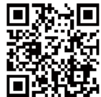
【QRコード】山鹿エールプロジェクト