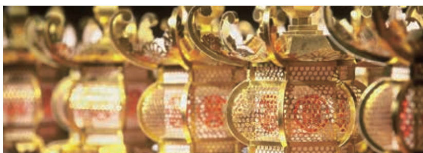
▲国の伝統的工芸品に指定された山鹿灯籠